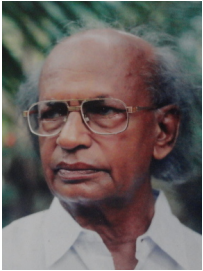
ആദ്യപ്രസിദ്ധീകരണവിവരം: വാരിക: കലാകൗമുദി ലക്കം: 512 തീയതി: 1985 07 07

1946. വക്കം അബ്ദുൾ ഖാദർ എസ്.കെ. പൊറ്റക്കാടുമായി ഞാൻ ജോലി ചെയ്യുന്ന ഓഫീസിൽ വന്നു. “ദ ഗ്രേറ്റ് പൊറ്റക്കാട്” എന്ന് അബ്ദുൾ ഖാദർ പരിചയപ്പെടുത്തി.