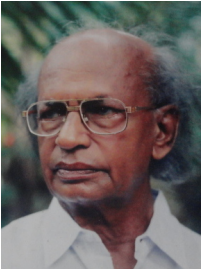
ആദ്യപ്രസിദ്ധീകരണവിവരം: വാരിക: കലാകൗമുദി ലക്കം: 512 തീയതി: 1985 07 07

ചാലക്കടയിലെ വില്ലന വസ്തുക്കളെല്ലാമെടുത്ത് പുത്തരിക്കണ്ടം മൈതാനത്തിലെ ഷെഡ്ഡുകളിലാക്കി അതിനു എക്സിബിഷൻ എന്നു കോർപ്പറേഷൻ പേരിടുന്നതു പോലെ സമുദായത്തെ മുഴുവൻ ഗ്രന്ഥങ്ങളിലാക്കി പ്രദർശിപ്പിച്ച് സമുദായ ചിത്രീകരണം എന്ന് പേരിടുകയാണ് നമ്മുടെ റിയലിസ്റ്റ് നോവലിസ്റ്റുകൾ (ഈ വാക്യം വികലമാണ്. തിരുത്താൻ സമയമില്ലാത്തതു കൊണ്ട് അത് അങ്ങനെ തന്നെ കിടക്കട്ടെ. ഭാഷയിലെ