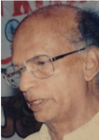
ആദ്യപ്രസിദ്ധീകരണവിവരം: വാരിക: കലാകൗമുദി ലക്കം: 519 തീയതി: 1985 08 25