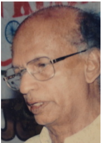
ആദ്യപ്രസിദ്ധീകരണവിവരം: വാരിക: കലാകൗമുദി ലക്കം: 519 തീയതി: 1985 08 25