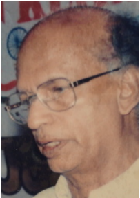
ആദ്യപ്രസിദ്ധീകരണവിവരം: വാരിക: കലാകൗമുദി ലക്കം: 519 തീയതി: 1985 08 25