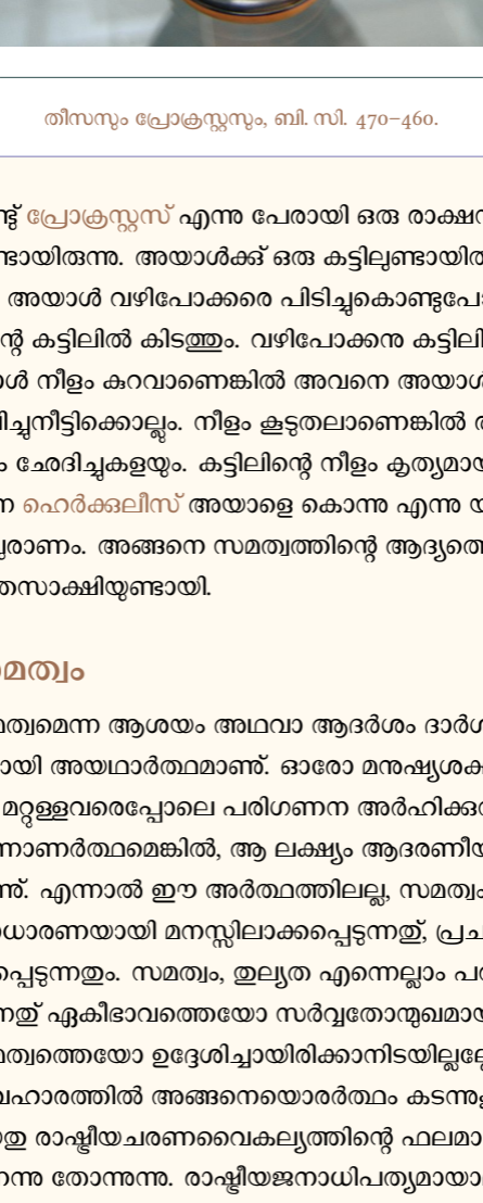
തിസസും പ്രോക്രസ്സും, ബി. സി. 470-460.

പണ്ട് പ്രോക്രസ്സ് എന്ന പേരായി ഒരു രാക്ഷസനായിരുന്നു. അയാൾക്ക് ഒരു കട്ടിലുണ്ടായിരുന്നു. അയാൾ വഴിപോക്കരെ പിടിച്ചുകൊണ്ടുപോയി തന്റെ കട്ടിലിൽ കിടത്തും. വഴിപോക്കനെ കട്ടിലിനെക്കാൾ നീളം കുറവുണ്ടെങ്കിൽ അവനെ അയാൾ വലിച്ചുനീട്ടിക്കൊല്ലും. നീളം കൂടുതലാണെങ്കിൽ രണ്ടറ്റവും ഛേദിച്ചുകളയും. കട്ടിലിന്റെ നീളം കൃത്യമായിരുന്ന ഹെർക്കുലീസ് അയാളെ കൊന്നു എന്ന യഥനപുരാണം. അങ്ങനെ സമത്വത്തിന്റെ ആദ്യത്തെ രക്തസാക്ഷിയുണ്ടായി.