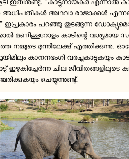
ദി എലിഫന്റ് വിസ്പറേഴ്സിന്റെ പോസ്റ്റർ.