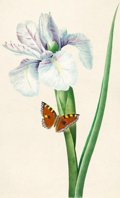
SPANISH IRIS (IRIS XIPHIMUM)