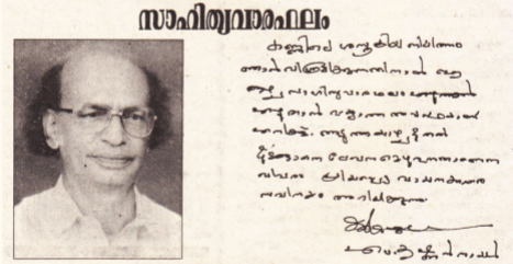
1995 ജൂൺ 25-ന് കലാകൗമുദി പ്രസിദ്ധീകരിച്ച കത്ത്.

സൗമ്യസ്വഭാവിയും ശാന്തനും ആതിഥ്യമര്യാദക്കാരനുമായിരുന്ന കൃഷ്ണൻ നായർ സാഹിത്യ വിമർശനത്തിൽ കർശനമായ മാനദണ്ഡങ്ങൾ അവലംബിച്ചു. രചിതാവിന്റെ പേരും പ്രശസ്തിയും അദ്ദേഹത്തിന് പ്രശ്നമായിരുന്നില്ല. കലാപരമായി ഔന്നത്യമുള്ള രചനകൾ മാത്രമാണ് സാഹിത്യമെന്നും മറ്റൊന്നും വ്യർത്ഥവ്യായാമങ്ങളാണെന്നും അദ്ദേഹം ഉറച്ചു വിശ്വസിച്ചു. സ്വന്തം ലേഖനങ്ങളെപ്പോലും 'സാഹിത്യ പത്രപ്രവർത്തനത്തിന്റെയും ഏഷണിയുടെയും ഒരു അവിയൽ' എന്നു വിശേഷിപ്പിച്ച അദ്ദേഹം അനുബന്ധമായി, 'അതുകൊണ്ടാണല്ലോ, ചുമട്ടുതൊഴിലാളികൾവരെയും 35 വർഷമായി സാഹിത്യ വാരഹലം വായിക്കുന്നത്' എന്നും കൂട്ടിച്ചേർത്തു. രസകരമായ രചനാശൈലിയും കുറിക്കുക കൊള്ളുന്ന നർമവും മലയാളികളുടെ ജീവിത ശൈലിയെക്കുറിച്ചുള്ള നിശിതവും ഹാസ്യാത്മകവുമായ നിരീക്ഷണങ്ങളും സാഹിത്യ വാരഹലത്തെ വായനക്കാർക്കു പ്രിയങ്കരമാക്കി.