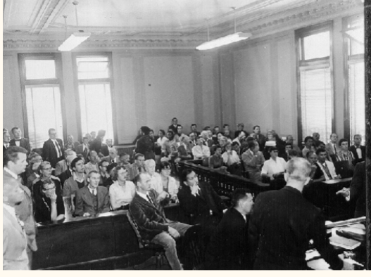
‘ഹൗളി’ന്റെ വിചാരണവേള 1957.

“പോലീസുകാർ ഇവിടെ നവോത്ഥാനം അനുവദിക്കില്ല” എന്ന തലക്കെട്ടോടെയാണ് ഒരു അമേരിക്കൻ പത്രം അലൻ ഗിൻസ് ബർഗിന്റെ “ഹൗളി”ന്റെ പ്രസാധകനായ ലോറൻസ് ഫെർലിംഗെറ്റിയുടെ അറസ്റ്റ് വാർത്ത കൊടുത്തത്. നീണ്ടവിചാരണയ്ക്കു ശേഷം ഒടുവിൽ “ഹൗളി”ൽ അശ്ലീലമില്ലെന്ന് കോടതി വിധിച്ചു. അവിടെ മലദ്വാരത്തിനും ഹൃദയത്തിനും ഒരേ സ്ഥാനമായിരുന്നു.