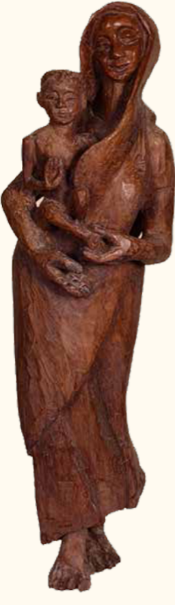
മധോണ (2016), എ സീൻ ഫ്രം എ വെയ്ക് എന്ന സീരിസിൽ നിന്ന്.